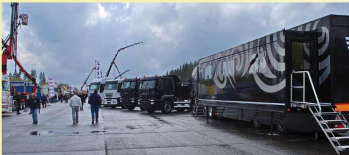
(Bilde fra en liten del av messeområdet på Gardermoen i mai 2009)

Mer info kommer når arrangementet nærmer seg! Vi ses på messa 2010!