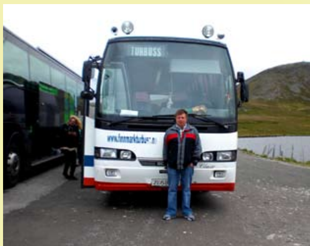
Klar for busstur med Spanske turister

En tirsdagsettermiddag i slutten av Juni begynte jeg å gjøre klar bussen for å ta i mot en ny gruppe spanske turister som har reist langt for å oppleve landet vårt. Min del av dette var å kjøre dem rundt i Vest-Finnmark og Troms.