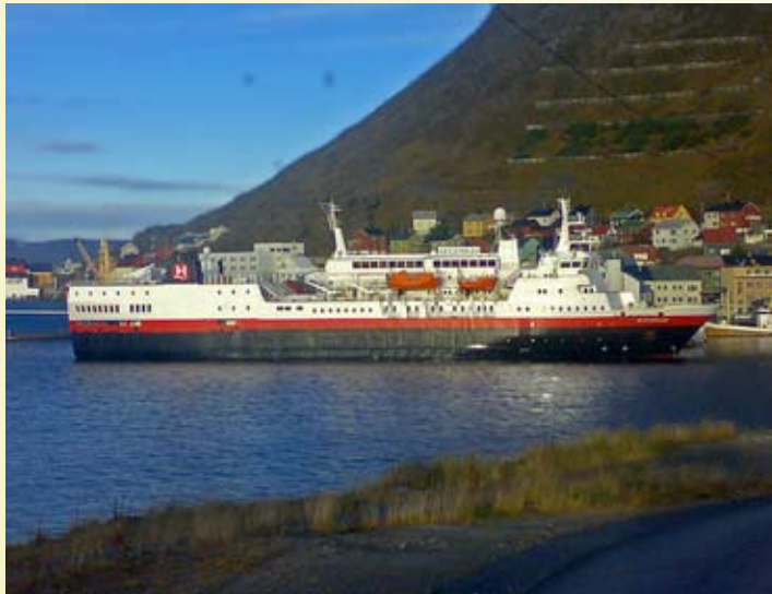
(Sol, sjø og vakker natur)

lokalbefolkningen omsetning på souvenirene sine. Etter en god time reiste vi videre, og vi tok det rolig over Sennalandet så de kunne se vår stolte natur. Ankom Rica Hotel Alta på ettermiddagen, og etter