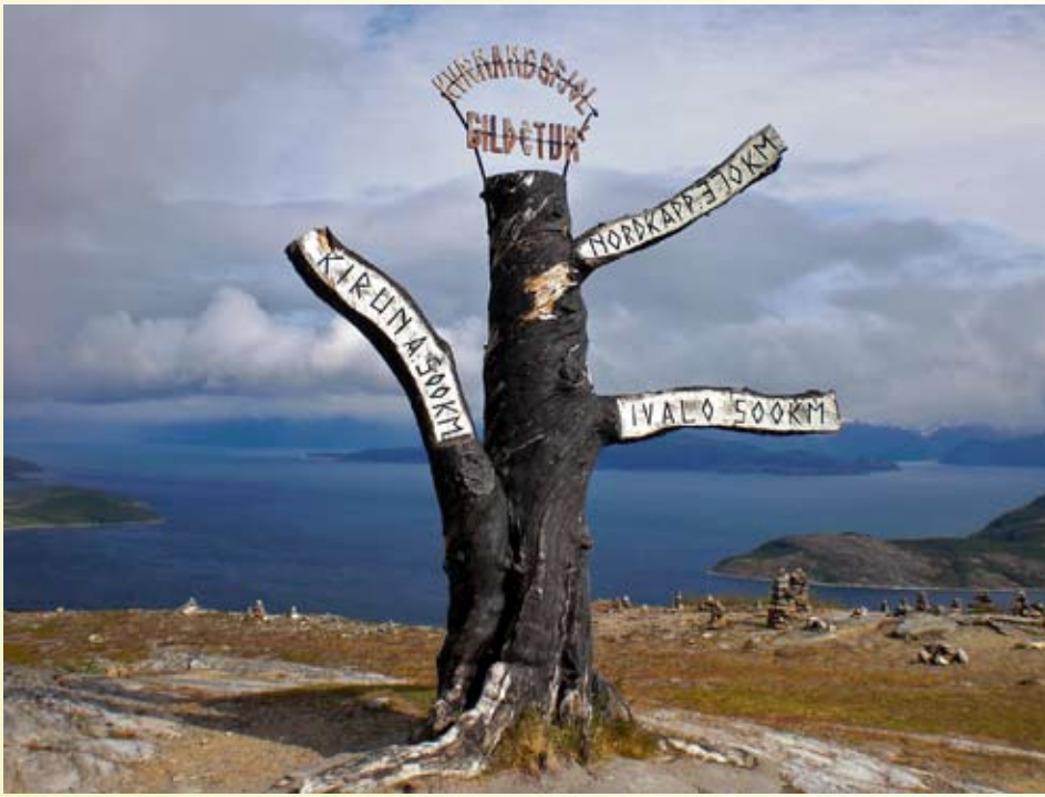
(Bildet tatt ved Gildetun på Kvænangsfjellet.)

lokalbefolkningen omsetning på souvenirene sine. Etter en god time reiste vi videre, og vi tok det rolig over Sennalandet så de kunne se vår stolte natur. Ankom Rica Hotel Alta på ettermiddagen, og etter