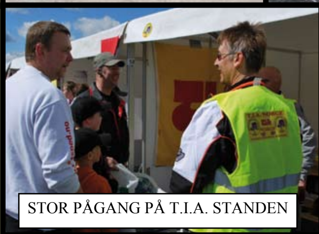
STOR PÅGANG PÅ T.I.A. STANDEN