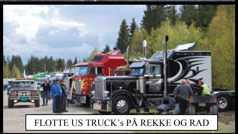
FLOTTE US TRUCK'S PÅ REKKE OG RAD