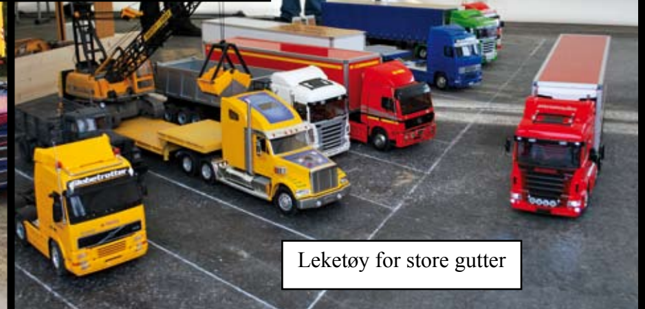
Leketøy for store gutter