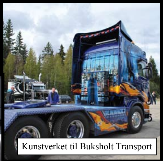
Kunstverket til Buksholt Transport