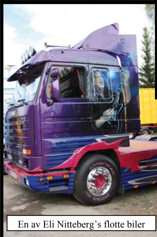
En av Eli Nitteberg's flotte biler