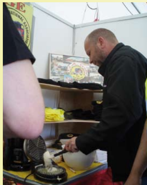
CB6402 var innom og prøvde seg som vaffelsteker

Dette resulterte i at vi fikk ca 60 – 70