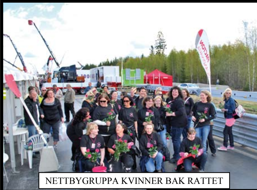
NETTBYGRUPPA KVINNER BAK RATTET