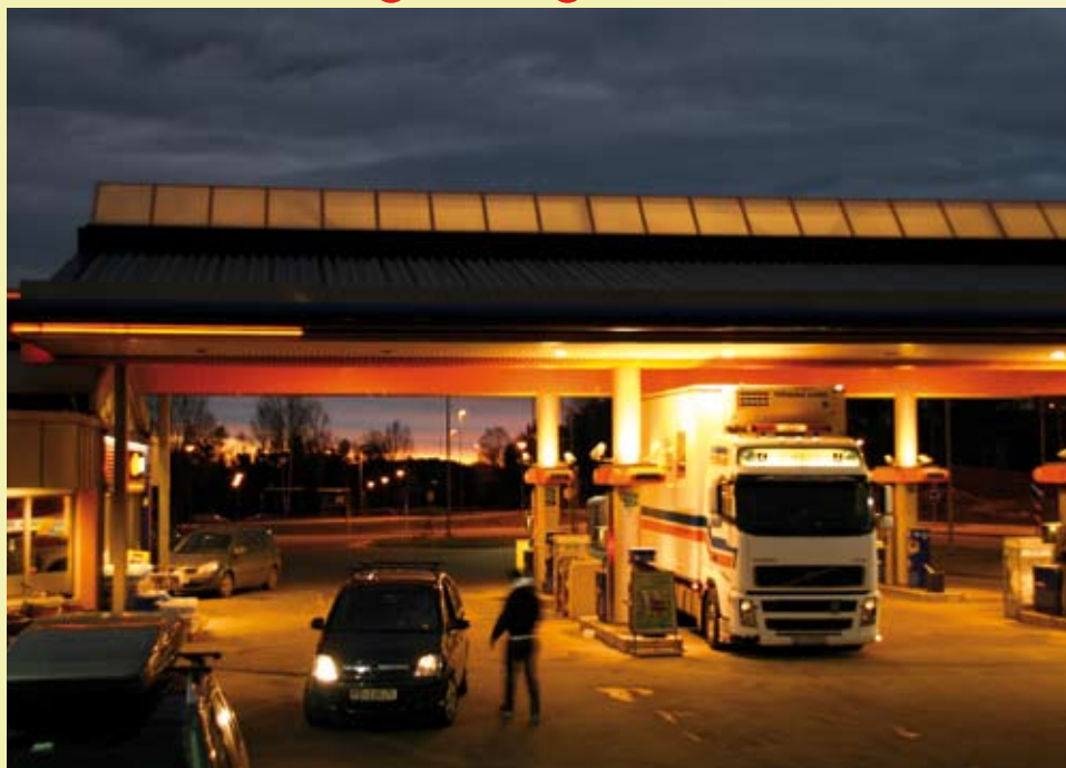
(Ny morgen etter en god natt's søvn)

Jeg har av en eller annen uforståelig grunn blitt spurt om å skrive litt i medlemsbladet vårt. Det meste er egne tanker og refleksjoner som kommer gjennom timene og dagene på og langs veien.