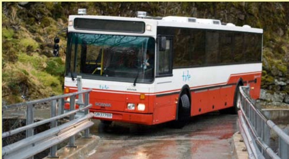
(Ikke like god plass på alle bussruter)

I vårt Transport-Norge har også bussen ein svært viktig rolle i samfunnsmaskineriet. Medan lastebilane, vogntoga, varebilane, budbilane, m.m. syt for varer til kundar som forretningar, industrien og næringslivet elles, samt direkte ut til folk, m.m., syt bussane, saman med taxiane for frakt av folk til der dei skal. Eg innrømmer glatt at første gongen eg hørde om TIA for nokre år sidan, trudde eg at TIA var for langtransportsjåførane. I prosessen som føregjekk under gjenstarten av TIA nyleg, stilte eg spørsmål om me som køyrer buss har noko i TIA og gjera. Så enda eg opp her for og formidla nettopp det, så rart det enn verkar for meg.